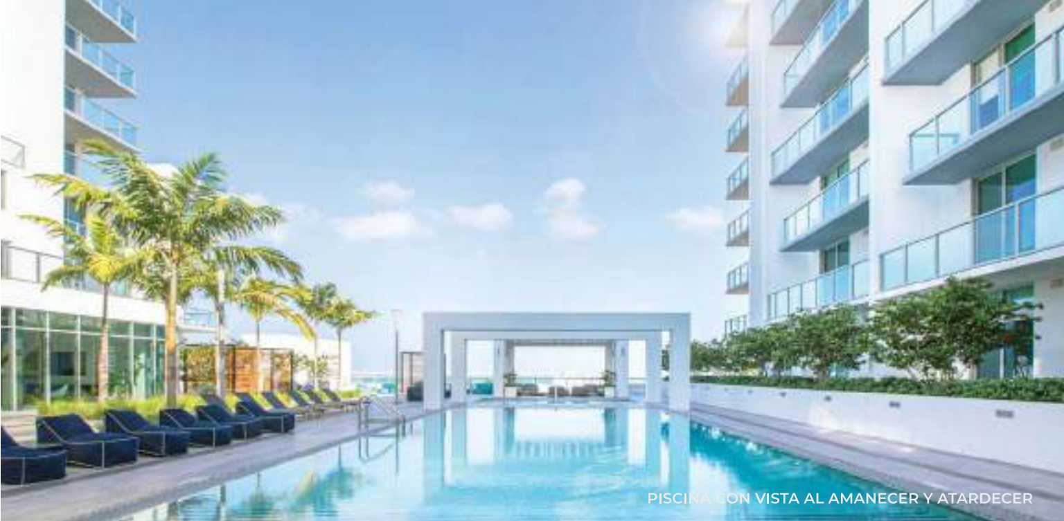
PISCINA CON VISTA AL AMANECER Y ATARDECER