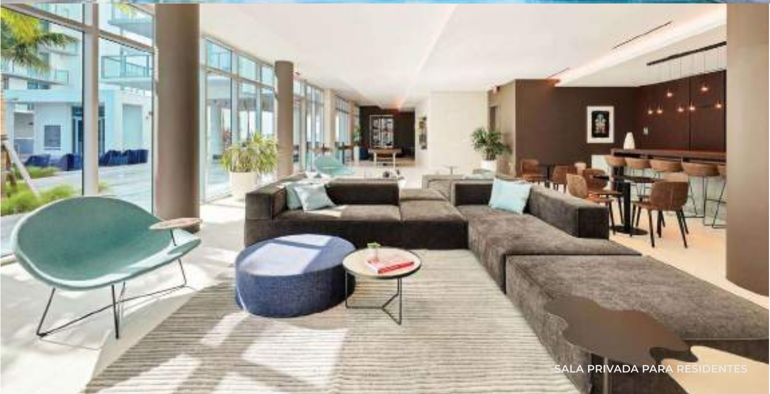
SALA PRIVADA PARA RESIDENTES